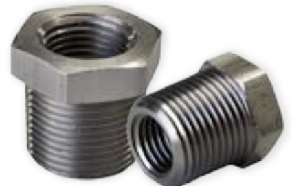
Nipples Reductores en Acero Inoxidable