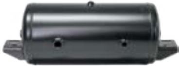
AZ-TNK-21 21" x 10"