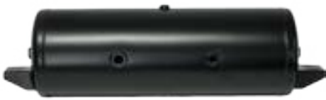
AZ-TNK-27 27" x 10"