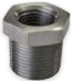
AZ-3412-RDC 3/4" a 1/2"